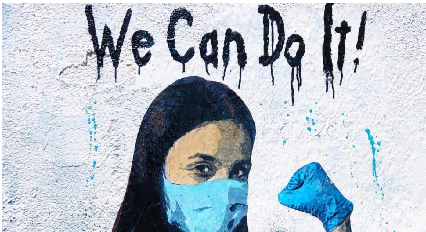
TvBoy - "We can do it" - Murales realizzato il 1° maggio 2020, Sicilia

“Nella vita solo se si è pronti a considerare possibile l'impossibile si è in grado di scoprire qualcosa di nuovo.” Goethe